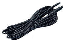
extension cable (AK1013)