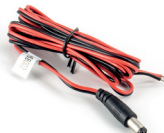
power cable (AK1001)