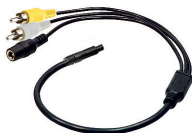
adapter cable (AK1011)